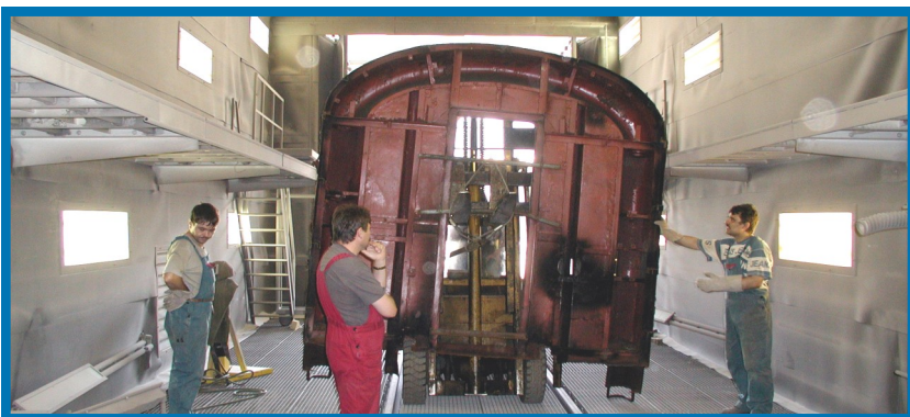
Bombardier Transportation MÁV Hungary Kft. - Dunakeszi