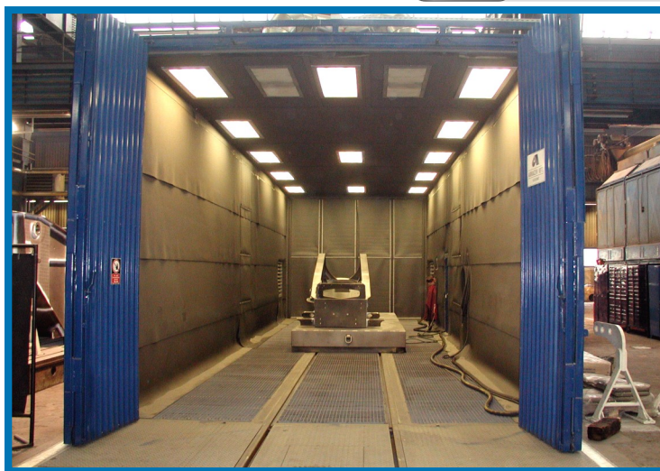
DEMAG Mobile Cranes Kft. PÉCS - Cameră de sablare, construcție interioară