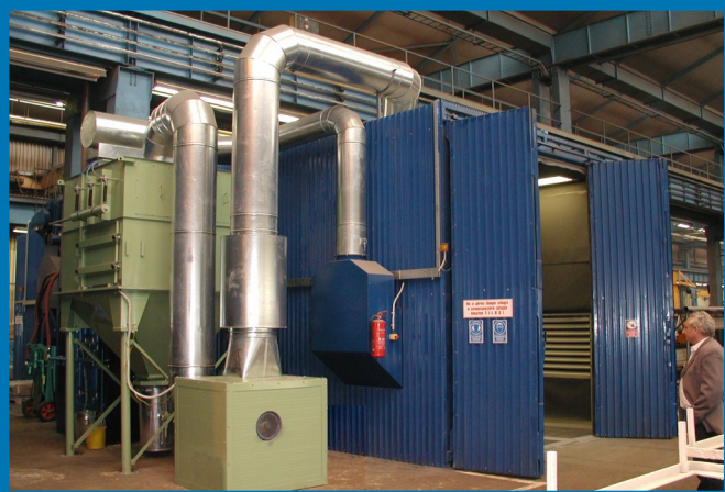
ABB Alstom. Budapest — Szóró terem, kültéri kivitel